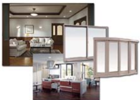
建材・住設・造作・サッシなど