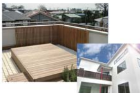
デッキ材・輸入塗料など